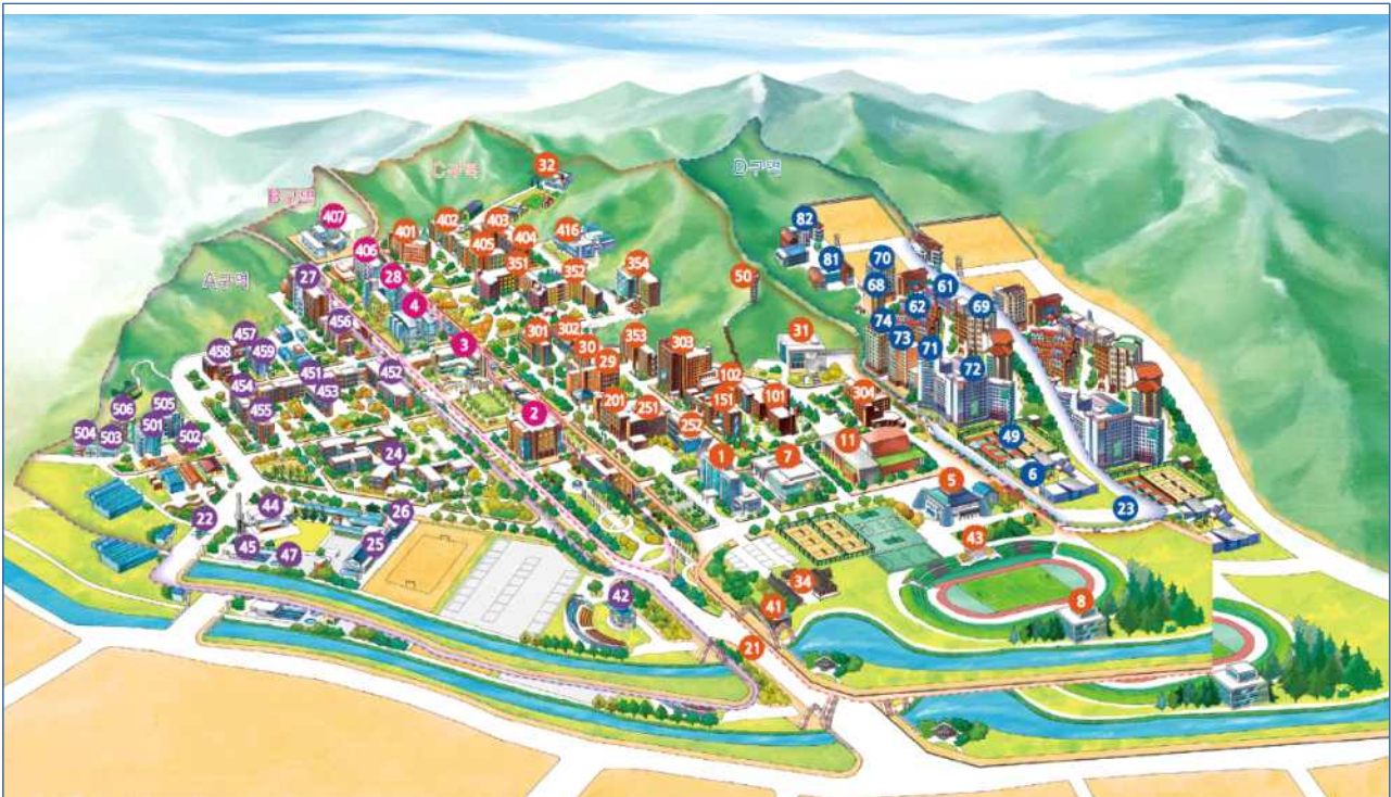
Gajwa Campus The hub for professional development in a premier industrial complex District A District B District C District D